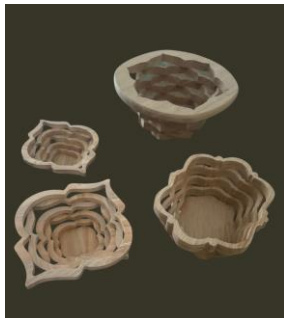
Léon HANSEL Objets en bois