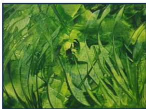
Lison HASS Peintures